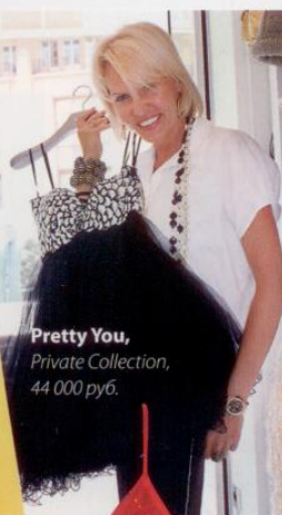
Pretty You, Private Collection, 44 000 руб.