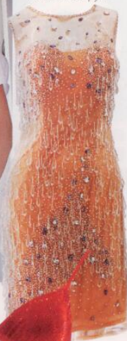
Pretty You, Private Collection, около 57 000 руб.