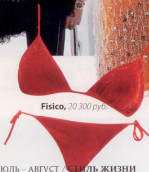
Fisico, 20 300 руб.